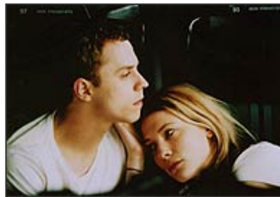
El filme alemán 'Heaven' inaugura el Festival de Cine de Berlín.