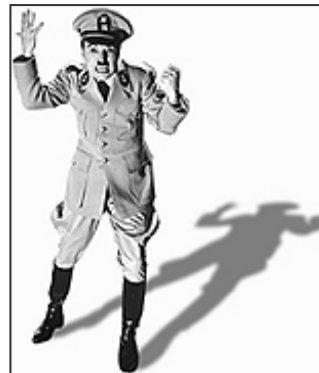
"El gran dictador".